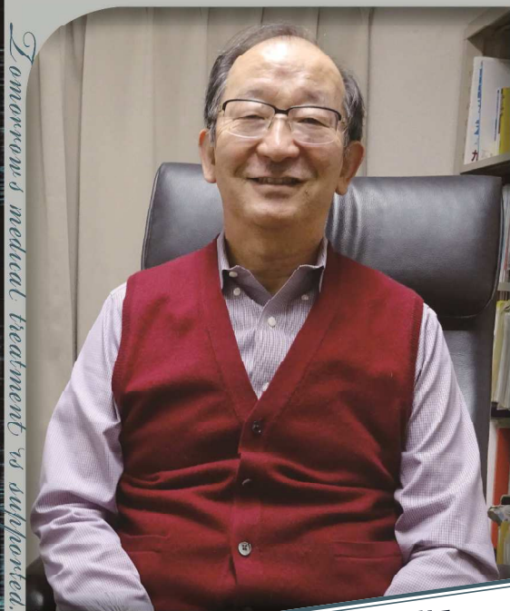
Tomorrow's medical treatment is supported.

睡眠障害は的確な治療で早期に改善します。当クリニックは睡眠障害専門の医療機関として、責任と自信をもって治療を行っています