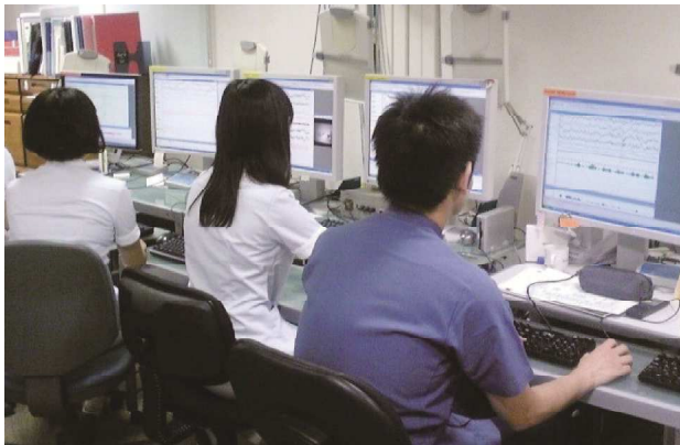
日本睡眠学会が認定する睡眠専門の検査技師が9人在籍

また主観的評価方法には、患者が日常の睡眠状態を長期にわたって記録する「睡眠日誌」、昼間の眠気を自己評価する「エッジ・ワース眠気尺度」、睡眠の質を検討する「ピッツバーグ睡眠質問票」などがある。これに対し客観的評価方法は医療機器を使う。小さな体動感知センサーを装着し、睡眠・覚醒リズムを評価する「アクチグラフィ」、一晩入院して睡眠の深さや睡眠中の呼吸状態を総合的に評価する「睡眠ポリグラフ検査」、2時間ごとに5回、入眠の様子を記録して過眠症（特にナルコレプシー）の診断や治療効果の判定に用いる「反復睡眠潜時検査」などがある。 「入院が必要な睡眠ポリグラフ検査をはじめ、睡眠障害では長時間の検査が多く、患者さんも検査をする医療機関も疲労度が大きい。そのため全国でも限られた施設でしか実施されていませんが、睡眠障害の診療や治療には専門的な検査に基づくデータが必要です。睡眠障害で悩まれている方は、睡眠医療のシステムが確立された専門施設